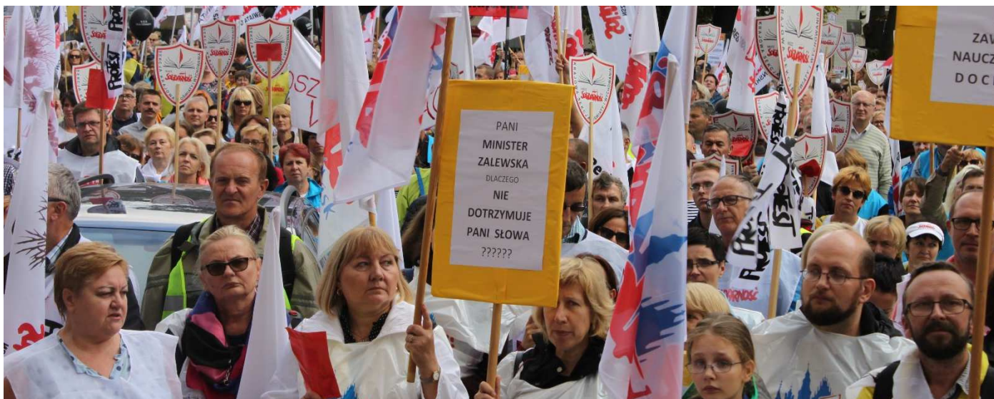
Warszawa 15 września

Pani minister stwierdziła podczas spotkania, że „związki zawodowe mają inną drogę dostępu do dialogu”, a także, że realizuje ona postulaty „Solidarności”. To kpina. Domagamy się podjęcia rzetelnej rozmowy na formułowane przez KSOiW NSZZ „Solidarność” postulaty i przedstawienie satysfakcjonujących nas rozwiązań.