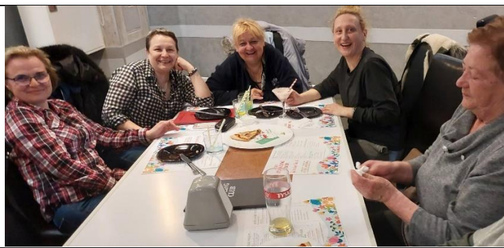
22 kwietnia odbyło się kolejne integracyjne spotkanie w OK Parku. Więcej zdjęć na naszej stronie.