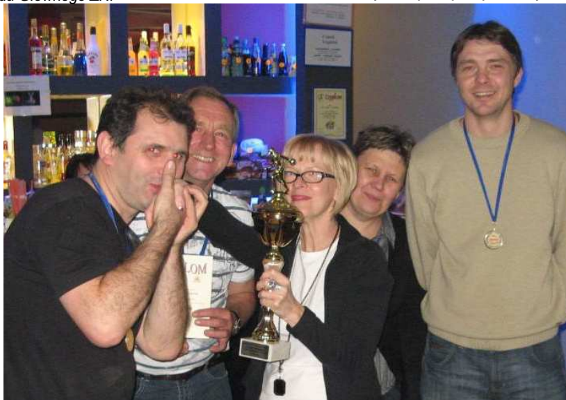
zwycięska drużyna GCEZ po dżentelmeńsku odbiera puchar